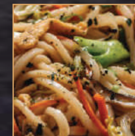
Udon + €1,00