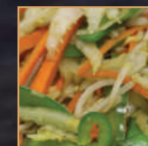
Yasai Itame (mix groenten) €7,75